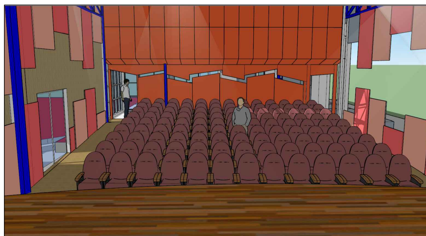
VISTA INTERIOR TEATRO DE ESCENARIO A FONDO