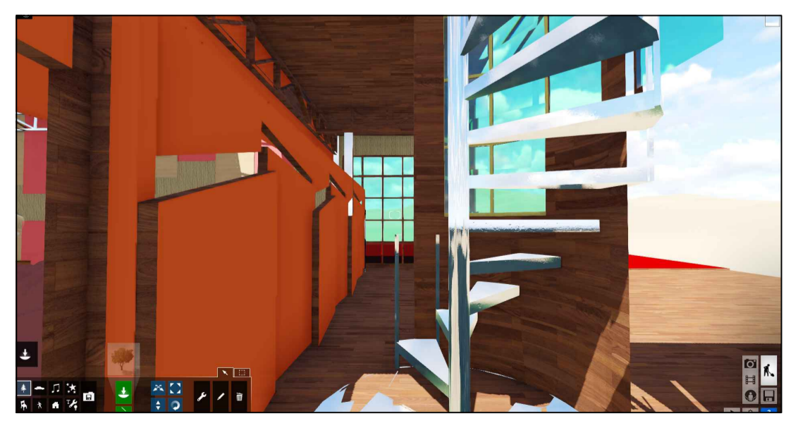
DETALLE PANEL DE ACCESO EN LOBBY TEATRO.