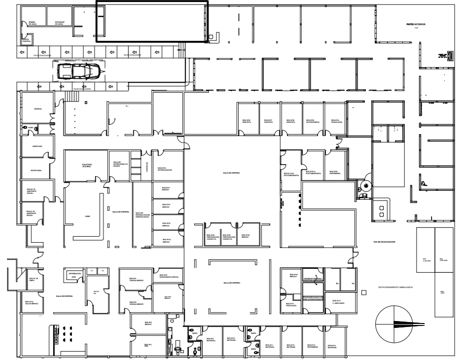
PLANTA DE UBICACIÓN 1º PISO (AMPLIACIÓN SALA E.R.A./TUBERCULOSIS) ESC.:1/500